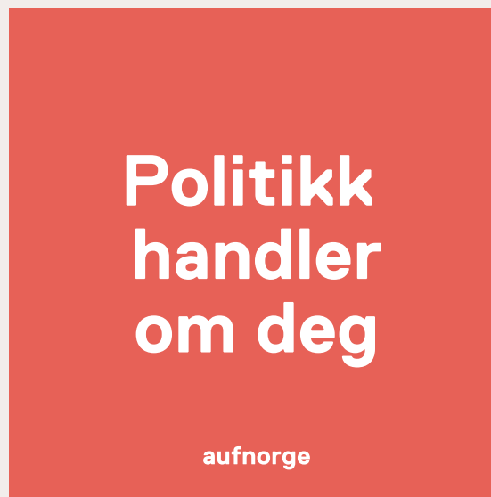
AUF Rød 70% opacity