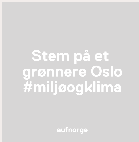
AUF Sort 20% opacity Kun nødvendig for å synliggjøre hvit tekst.