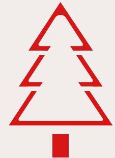
Miljø og klima