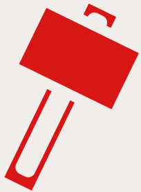
Skole og arbeid